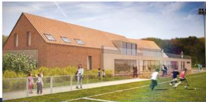
LILLE MÉTROPOLE HOCKEY CLUB - 2024

Site officiel LILLE, TERRE DE JEUX base arrière des JO de Paris 2024 Projet soutenu par la Fédération Française de Hockey