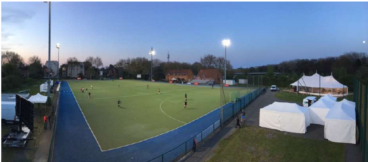
Coupe d'Europe féminine 2019

NB. l'éclairage halogène très consommateur d'énergie a fait l'objet d'un changement en 2018 entièrement financé par le club afin de maintenir le niveau international de l'installation.