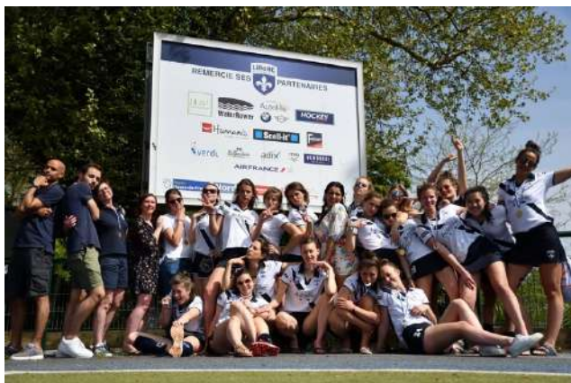
Coupe d'Europe Féminine Mai 2019