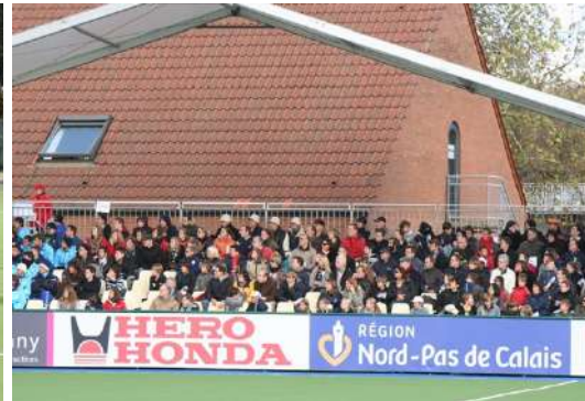
Match France / Belgique Octobre 2019